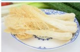
竹荪 Dictyophora Indusiata