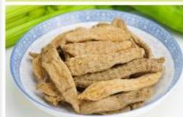
天麻 (中) Gastrodia Elata (M)