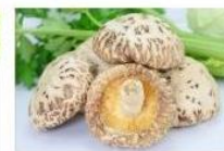
花菇王 The Biggest Blossom Mushroom