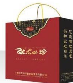
伏龙山珍品4合1礼盒 规格: 35.5x30x11.5cm Fulongshan Treasured-gift Product Specification: 35.5x30x11.5cm