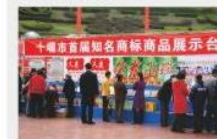
参加商品展销会 Participating in Product Exhibition Fair