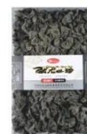
黑木耳 350g Black Fungus