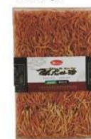
虫草 300g Cordyceps Taishanensis