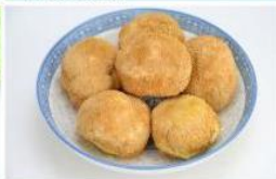
猴头菇 Heridium Erinaceus