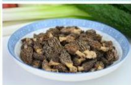
羊肚菌 (小) Toadstool (S)