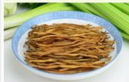
黄花菜 Natural Daylily