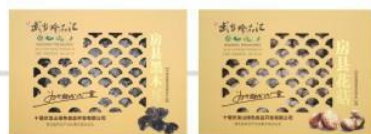
房县黑木耳 300g Fangxian Black Mushroom