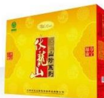
伏龙山珍品4合1组合装礼盒 规格: 42x31x90cm Fulongshan Treasured-gift Product Specification: 42x31x90cm