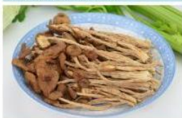
茶树菇 Agrocybe Cylindracea