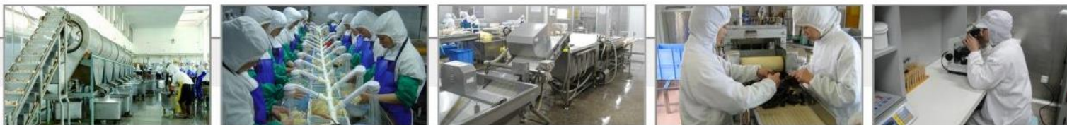
设备与生产线 Equipments and Production Lines