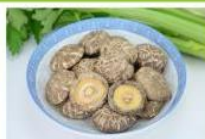
茶花菇 Fulvous Flower Mushroom