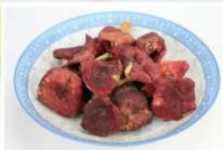
红菇B级 Russulas Class B