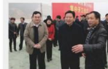
领导视察基地建设 Leader's inspecting base construction