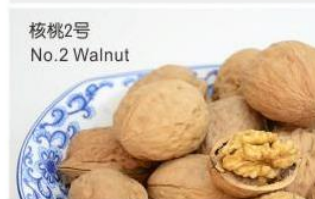
核桃2号 No.2 Walnut