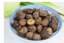
光面菇 Smooth Mushroom