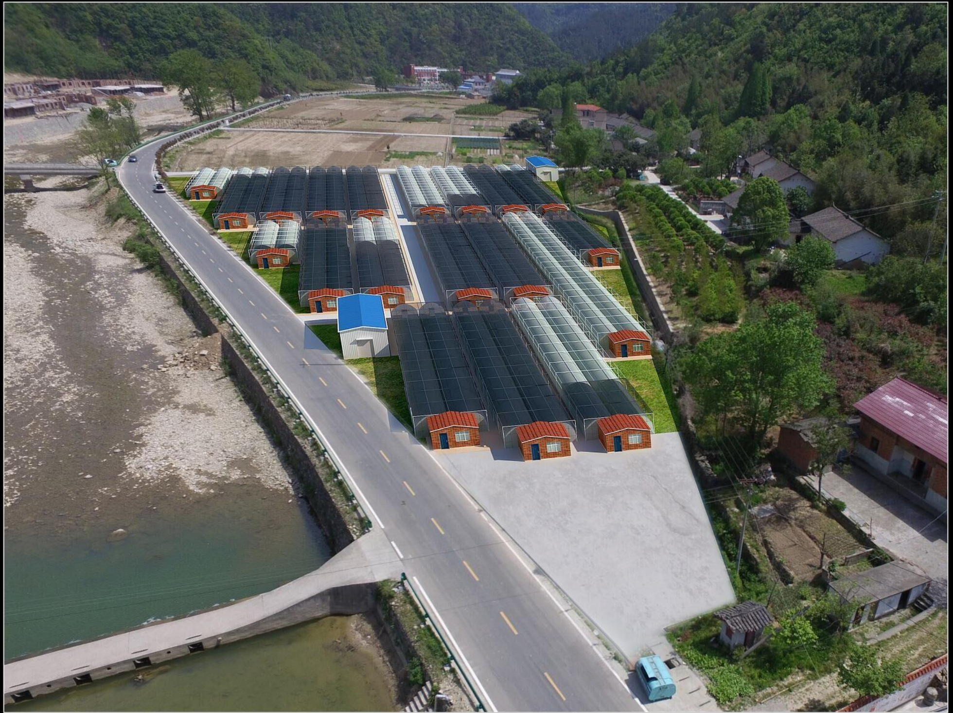
伏龙山珍食用菌标准化种植基地