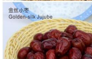
金丝小枣 Golden-silk Jujube