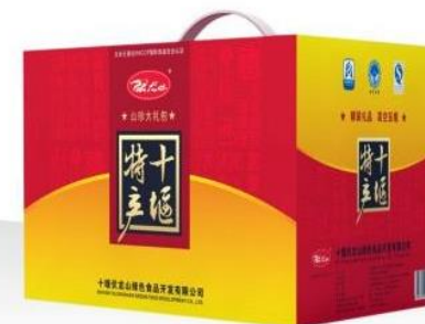
伏龙山珍品混合装礼盒 规格: 40x25x30cm Fulongshan Treasured-gift Product Mixture Box-packaged Specification: 40x25x30cm