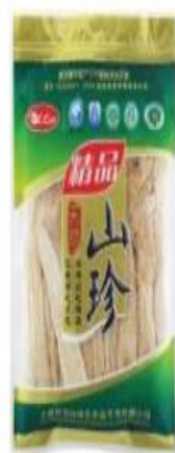
竹荪 Dictyophora Indusiata