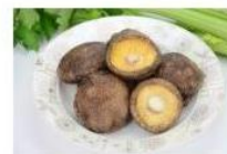
光面菇 Smooth Mushroom