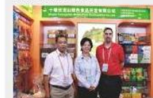
参加广交会与国外客户洽谈 Negotiating with clients at Canton Fair