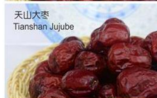
天山大枣 Tianshan Jujube