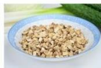
香菇粒 Granular Mushroom