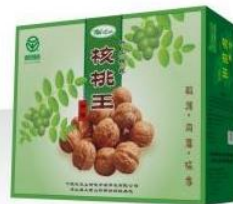
伏龙山珍品核桃礼盒 规格: 34x28x15cm Fulongshan Treasured-gift Product of Walnut Specification: 34x28x15cm