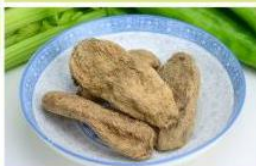
天麻 (大) Gastrodia Elata (L)