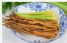
竹笋 Bamboo Shoots