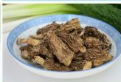
羊肚菌 (中) Toadstool (M)