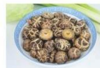
茶花菇 Fulvous Flower Mushroom