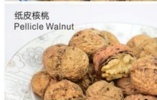
纸皮核桃 Pellicle Walnut