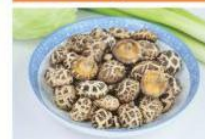
花菇 Blossom Mushroom