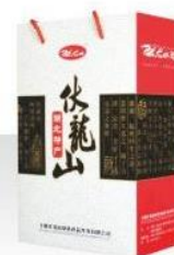
伏龙山珍品PP透明礼盒 规格: 20x30x11cm Fulongshan Transparent PP Gift Product Specification: 20x30x11cm