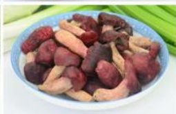
红菇A级 Russulas Class A