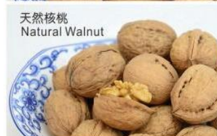
天然核桃 Natural Walnut