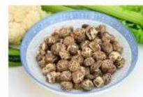
花菇 Blossom Mushroom