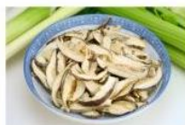
冬菇丝 Filamentous Mushroom