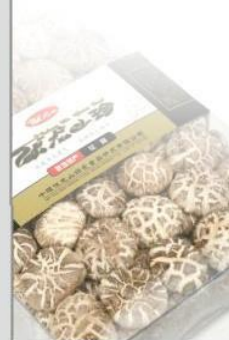
规格: 19x28x5cm Specification: 19x28x5cm