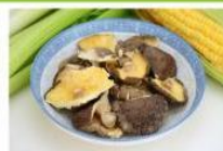
光面菇 (破片) Fragment Smooth Mushroom