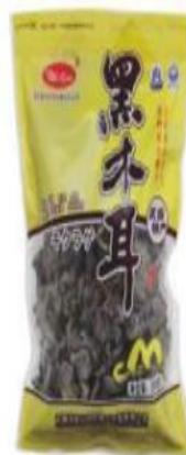
黑木耳 Black Fungus