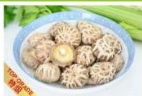
天白花菇 Log White Blossom Mushroom