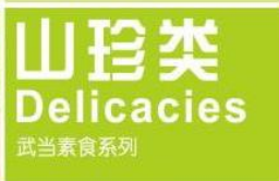
山珍类 Delicacies 武当素食系列