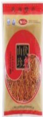
虫草菌 Cordyceps Taishanensis