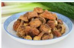
松茸 Tricholoma Matsutake